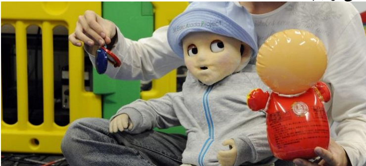
روبات نوزاد ژاپنی برای ترغیب خانواده‌ها به فرزندآوری

ژاپن نیز با نرخ باروری 1/42 فرزند به ازای هر زن، جزو کشورهای دارای پایین‌ترین آهنگ رشد جمعیت است. ژاپنی‌ها در اقدامی جالب برای ترغیب خانواده‌ها به داشتن فرزند، به ساخت «روبات نوزاد» پرداختند. این روبات می‌خندد، گریه می‌کند و وقتی تکانش بدهند، آرام می‌شود. اگر آن را قلقلک بدهند، می‌خندد و حتی آب بینی‌اش هم بعد از گریه راه می‌افتد. سازندگان این روبات، امیدوارند مشاهده این اختراع، خانواده‌های ژاپنی را به داشتن نوزاد واقعی ترغیب کند.