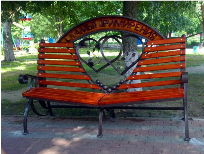
«نیمکت آشتی همسران» در پارک‌های مختلف روسیه

پوتین، سال ۲۰۰۸م را در این کشور به عنوان «سال خانواده» نام‌گذاری کرد و در این سال، برنامه‌های فرهنگی مختلفی در راستای نزدیک‌تر کردن عاطفی همسران به یکدیگر و ترویج فرزندآوری بیشتر طراحی و اجرا شد. اولین روز تعطیل این سال به عنوان «روز خانواده، عشق و وفاداری» نام‌گذاری شد که با برنامه‌های مختلفی در سرتاسر روسیه همراه گشت. پیرو راه‌اندازی کمپین ترویج ازدواج و تکریم خانواده در روسیه، برنامه‌های تبلیغاتی مختلفی با این هدف در رسانه‌ها و فضاهای خیابانی و مترو به چشم می‌خورد؛ برای مثال، بر روی بیلборدهای بزرگی در شهرهای روسیه تصاویر کودکانی دیده می‌شود که در بالای این بیلبوردها، شعار واحدی نوشته شده است: «سرزمین ما، به کودکان شما نیاز دارد.»