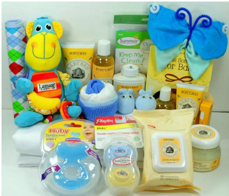
بسته خوش آمدگویی دولت فنلاند به نوزادان