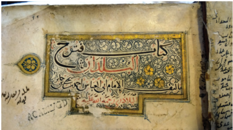
تصویر ۱ صفحه عنوان تذهیب شده فتوح البلدان (نسخه دانشگاه لایدن)