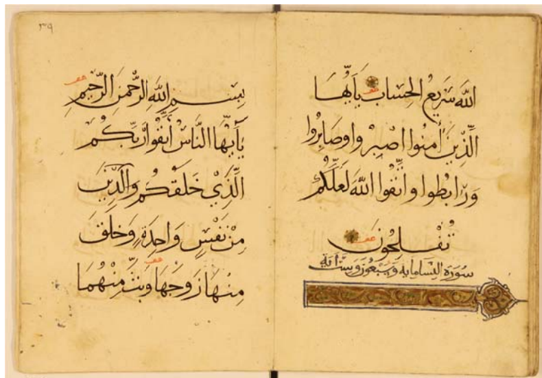
آغاز سورة نساء در قرآن وقفی بندار ممولة مشهدی (به تاریخ ماه رمضان ۶۱۴ قمری)