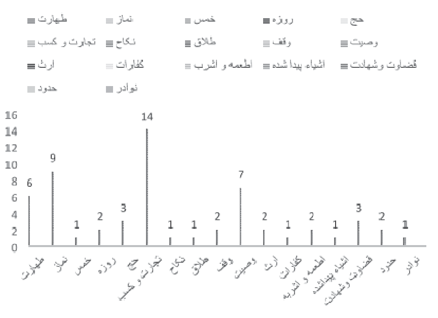
الرسم (المخطط) البياني لتوضيح مكانة الإمامة

دراسة وتحليل مضمون رسائل الإمام الحسن العسكري عليه السلام