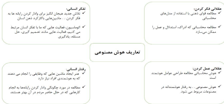
شکل ۱. تعاریف هوش مصنوعی (Russell & Norvig, 2010, p. 2)

ریاضی وار محقق می‌کند؛ به این معنا که ما انتخاب می‌کنیم یک داده از پیش معین شده در همه جا مورد استفاده باشد. این صرفاً برای یادآوری این نکته است که فناوری شرایط ارزشی را در بر می‌گیرد و بنابراین نمی‌توان آن را تنها به مثابه یک ابزار تجربی خنثی در نظر گرفت (Mickunas & Pilotta, 2023, p. 183). برای تبیین موارد بالا به نمودار زیر توجه کنید: